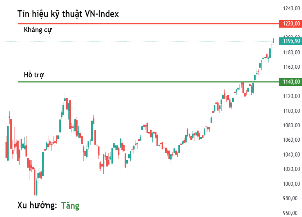
Tín hiệu kỹ thuật VN-Index