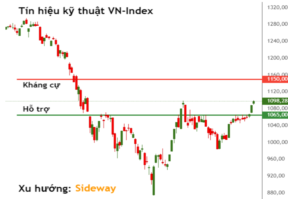
Tín hiệu kỹ thuật VN-Index