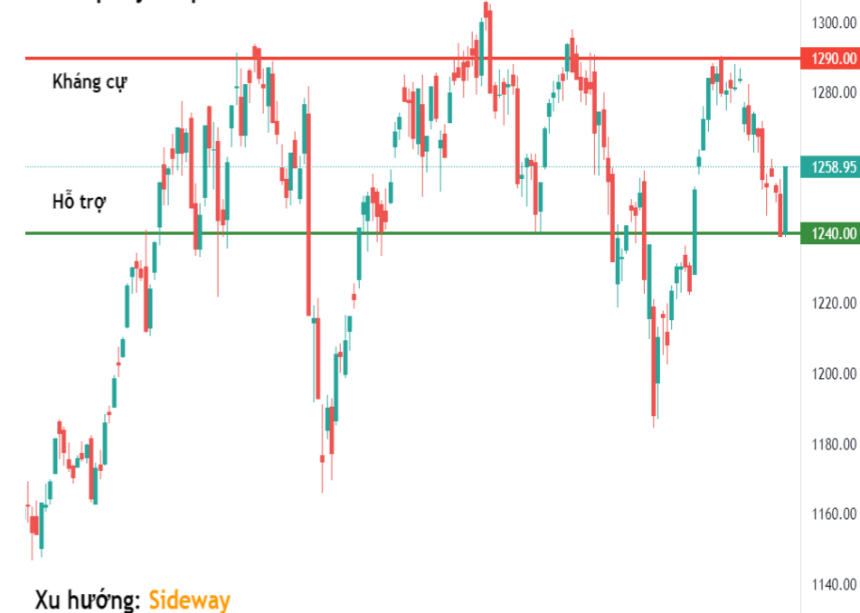
Tín hiệu kỹ thuật VN-Index