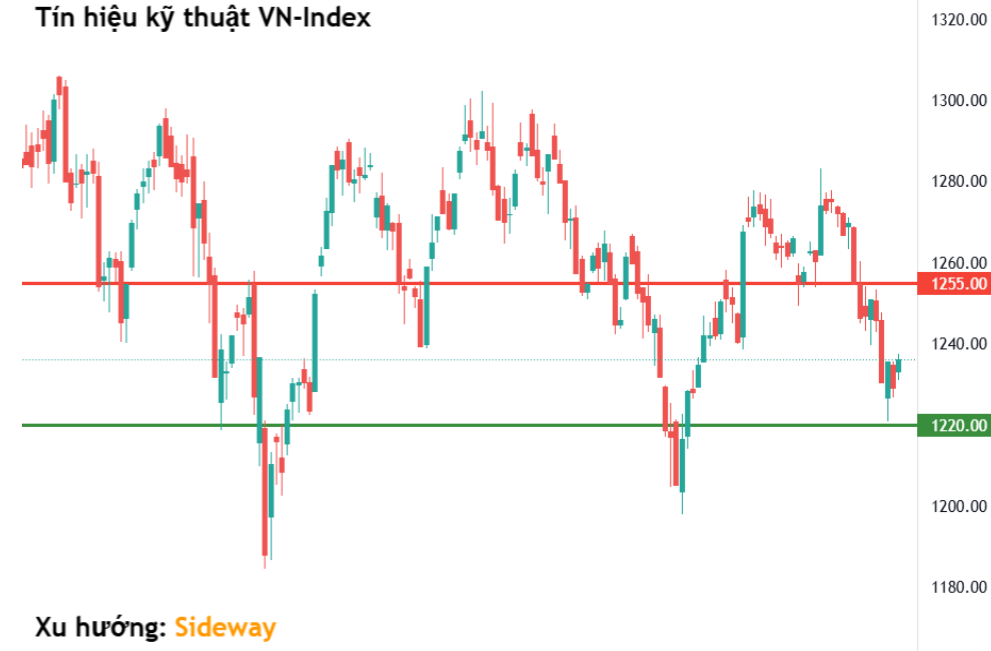
Tín hiệu kỹ thuật VN-Index