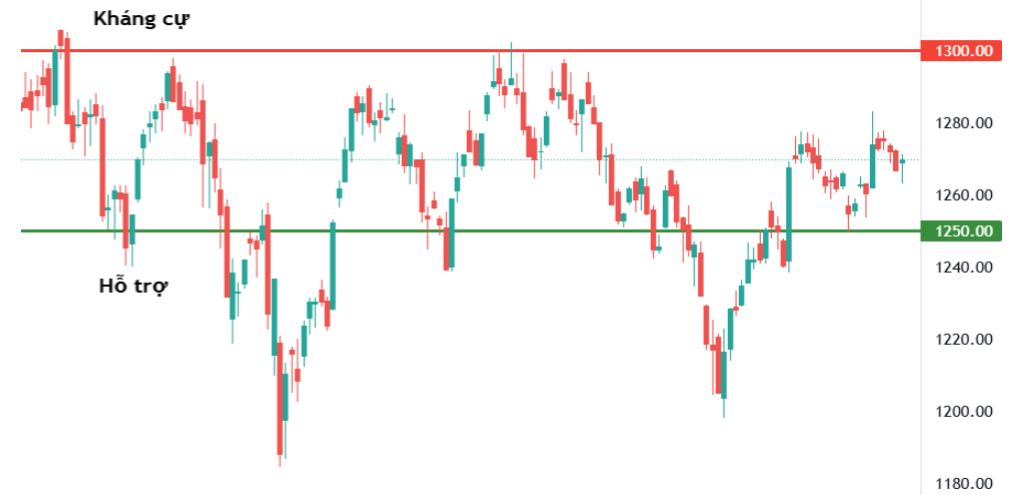
Tín hiệu kỹ thuật VN-Index