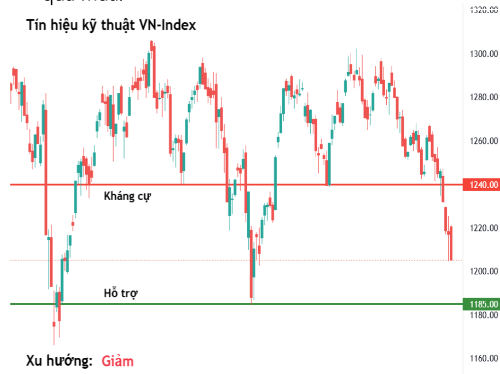
Tín hiệu kỹ thuật VN-Index