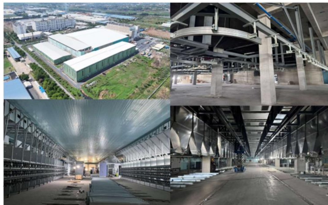
Hình 2 : Nhà máy Unitex đã lắp đặt gần xong