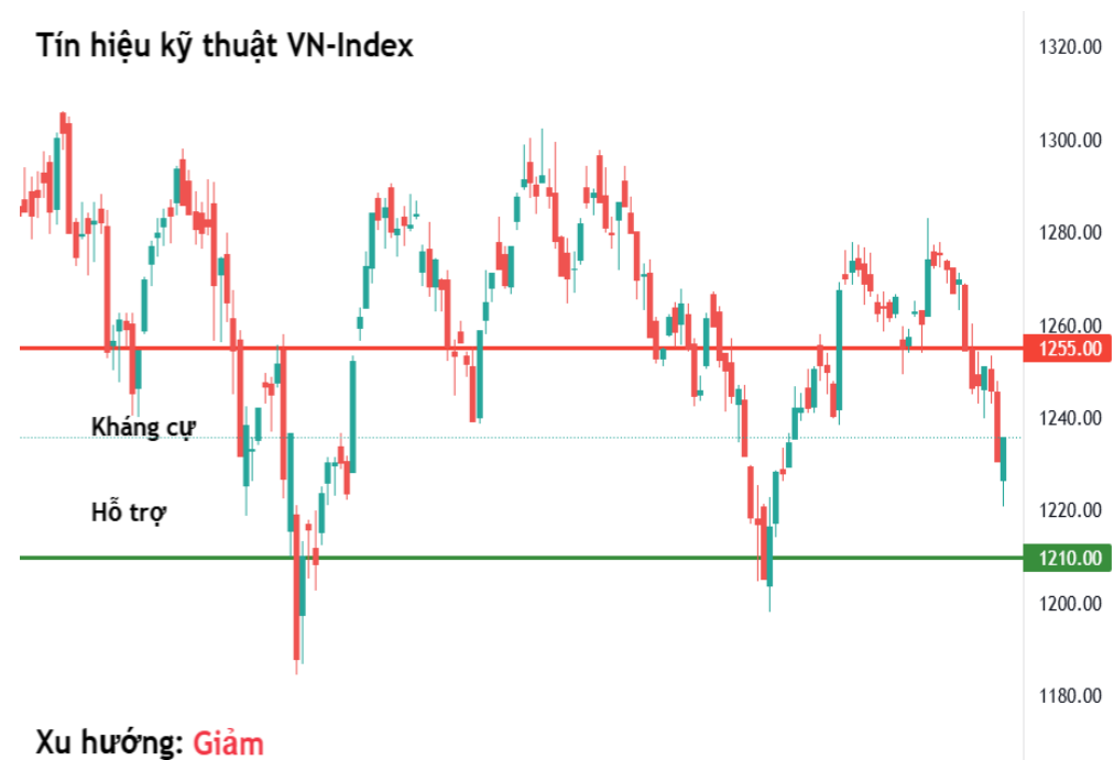
Tín hiệu kỹ thuật VN-Index