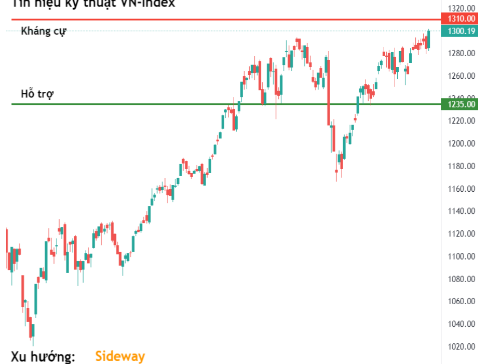
Tín hiệu kỹ thuật VN-Index