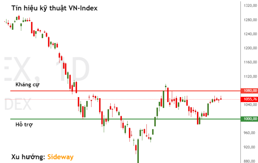
Tín hiệu kỹ thuật VN-Index