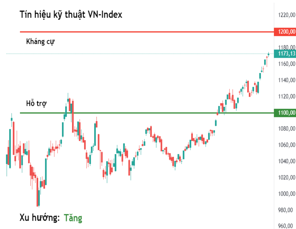
Tín hiệu kỹ thuật VN-Index