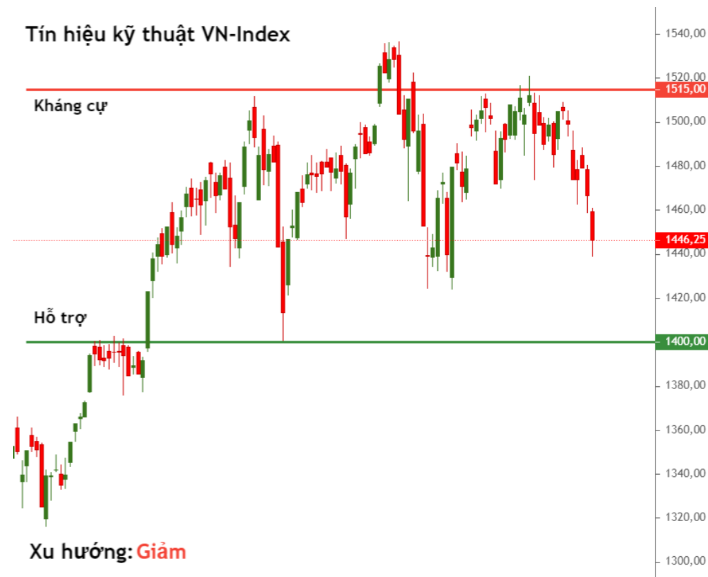
Tín hiệu kỹ thuật VN-Index