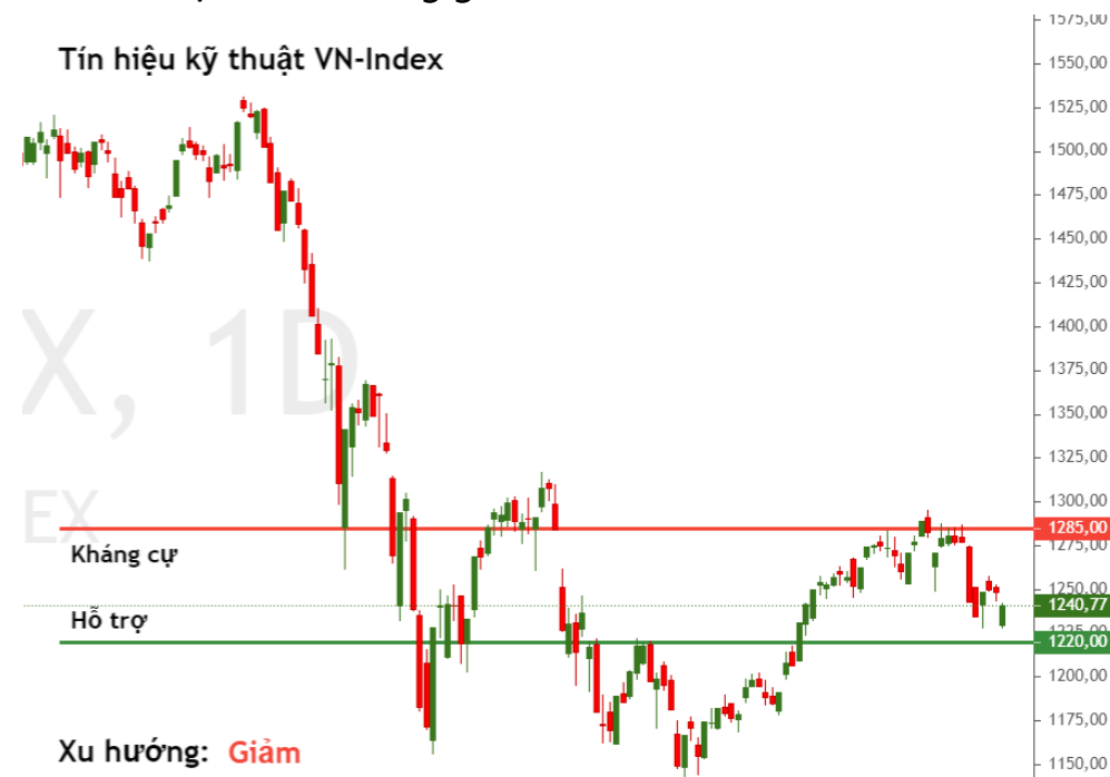
Tín hiệu kỹ thuật VN-Index