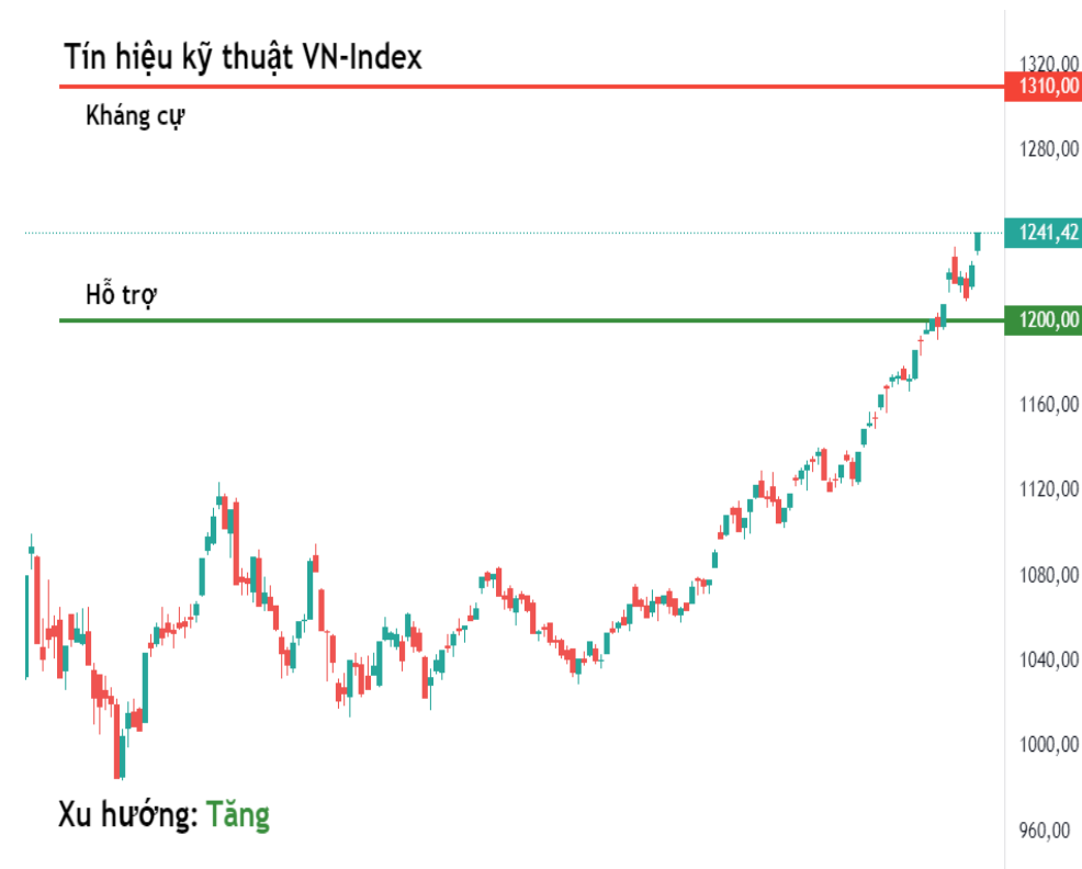
Tín hiệu kỹ thuật VN-Index