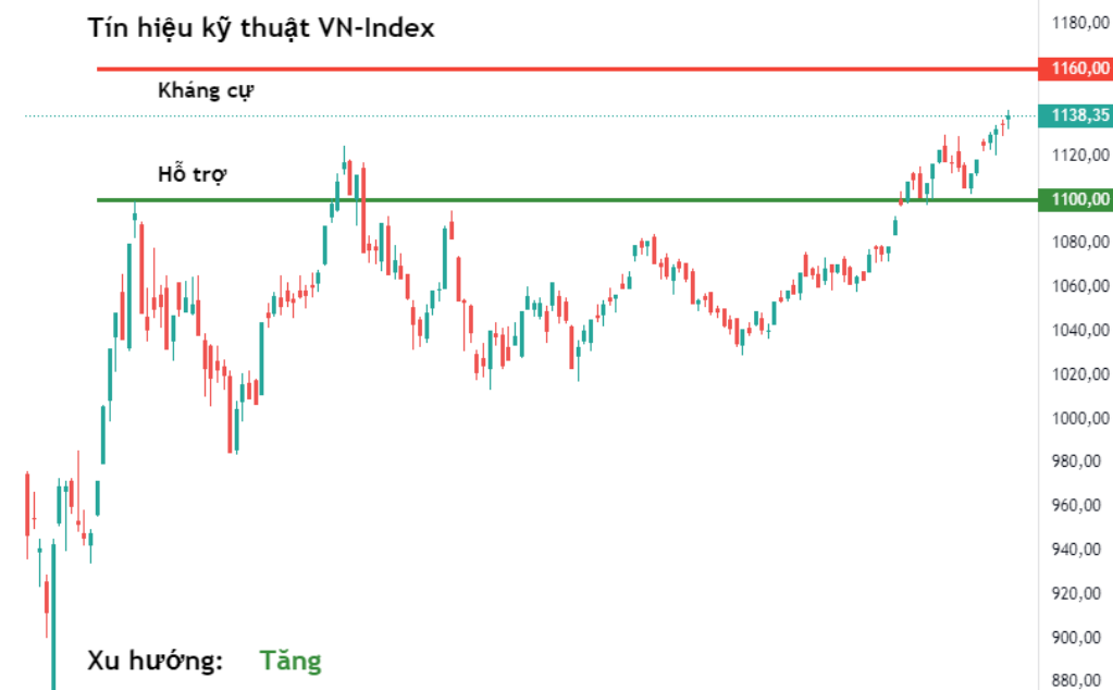
Tín hiệu kỹ thuật VN-Index