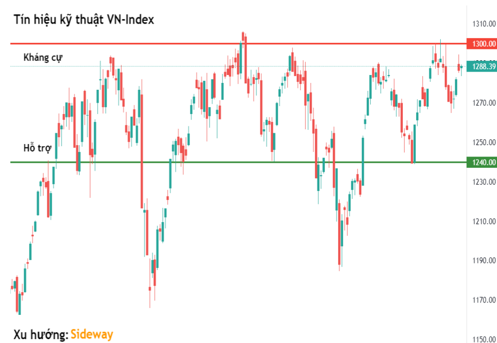
Tín hiệu kỹ thuật VN-Index