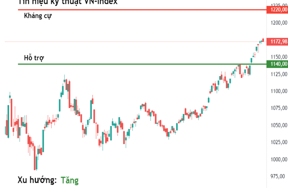
Tín hiệu kỹ thuật VN-Index