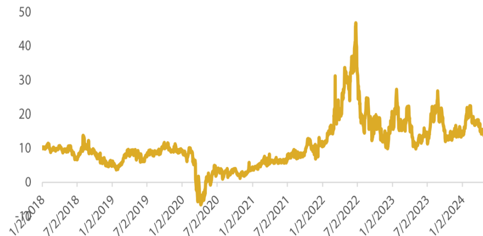
Hình 1: Diễn biến crack spread 2-2-1 (USD)

Đơn vị kỳ vọng crack spread 3:2:1 năm 2024 đạt 14,8 USD (-8,6% YoY), cao hơn kế hoạch đề ra là 8,9 USD. Trong khi đó crack spread hiện tại là 12,8 USD (-15% YTD). Tuy nhiên crack spread có xu hướng tăng trong trong Q3 (tháng 7 – 8) chủ yếu do đây là mùa du lịch của các nước lớn như Mỹ, Châu Âu và thậm chí là Việt Nam. Do đó chúng tôi kỳ vọng KQKD 6 tháng cuối năm 2024 phục hồi tốt hơn nửa đầu năm. Ngoài ra việc dự án mở rộng nhà máy được đẩy mạnh sau một thời gian trì hoãn là một điểm sáng cho BSR.