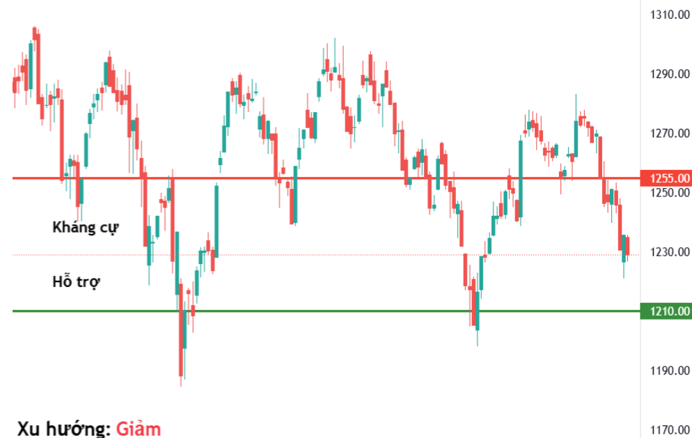
Tín hiệu kỹ thuật VN-Index