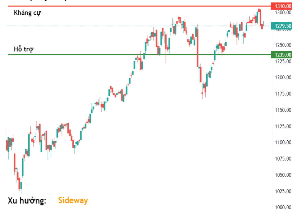
Tín hiệu kỹ thuật VN-Index